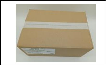
Caja con film protector