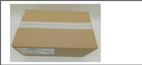
Caja con film protector