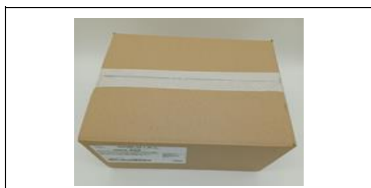
Caja con film protector